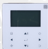
télécommande filaire WDC-120G/WK