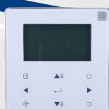
télécommande filaire WDC-120G/WK

Taille compacte et conception élégante. Installation simple. Deux sorties d'air et quatre entrées d'air. Fonctionnement à faible niveau sonore 26 dBa.