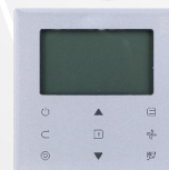
télécommande filaire WDC-86E/KD