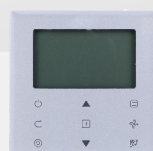
télécommande filaire WDC-86E/KD