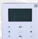
télécommande filaire WDC-120G/WK