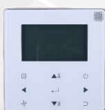
télécommande filaire WDC-120G/WK