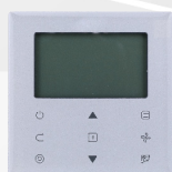
télécommande filaire WDC-86E/KD