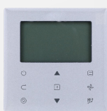
télécommande filaire WDC-86E/KD