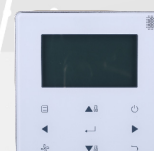
télécommande filaire WDC-120G/WK

Le flux d'air à 360 ° permet un refroidissement et un chauffage uniformes et étendus. Pompe de vidange avec tête de pompe de 500 mm montée en standard.