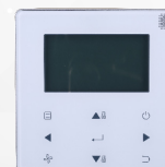
télécommande filaire WDC-120G/WK